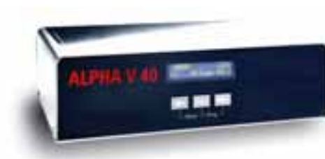
Controller Box Alpha V40

Der Controller bietet standardmäßig zahlreiche Funktionen, z.B. die Speicherung von 30 Parameter-Sets mit allen notwendigen Informationen wie Etikettenlänge, -opazität, Spendegeschwindigkeit und -platzierung. So kann schnell auf andere Formate umgestellt werden. Die Kalibrierung des Systems ist nicht nötig, was Zeit spart und Bedienerfehler vermeidet. Sensorfunktionen sind permanent im hintergrundbeleuchteten und mit Etikettenzähler ausgestatteten LC-Display ablesbar. Die Spendegeschwindigkeit wird in m/min angezeigt und kann im laufenden Betrieb angepasst werden. Störungen werden in Klartext angezeigt. Weiteres Plus: das optionale Controller-Back-up-, mit dem alle variablen Daten (z.B. Etiketten-Parameter-Sets) einfach und sicher seriell (RS 232) auf einen Reserve-Controller kopiert werden können.