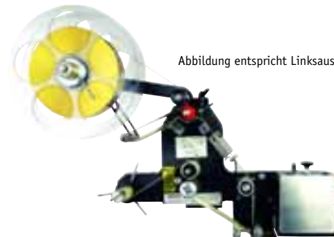
Abbildung entspricht Linksausführung

Bei der Blow-Box-Version wird das Etikett ohne weiteren Bewegungsablauf per Air-Jet berührungslos direkt auf das vorbeilaufende oder stehende Produkt „geschossen“. Das bringt hohe Spendetakraten bei einem Produktabstand von 6 bis 20 mm.