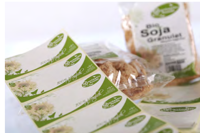
Selbstklebendes Vordrucketikett für Bioprodukte