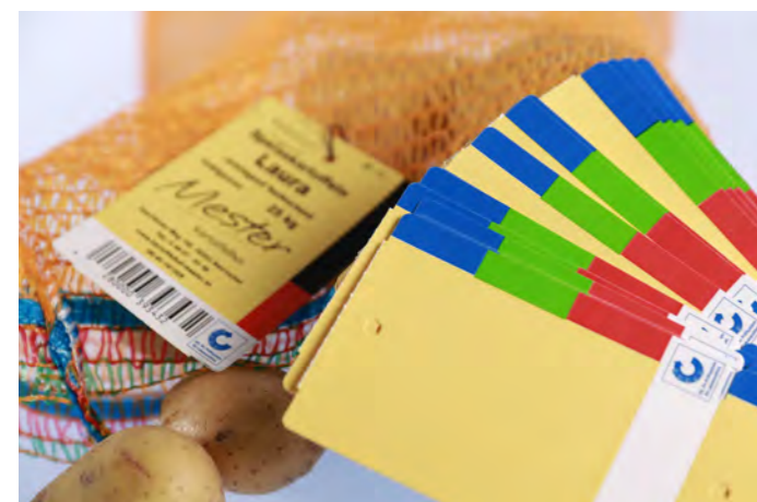
Kartonanhänger für Obst und Gemüse