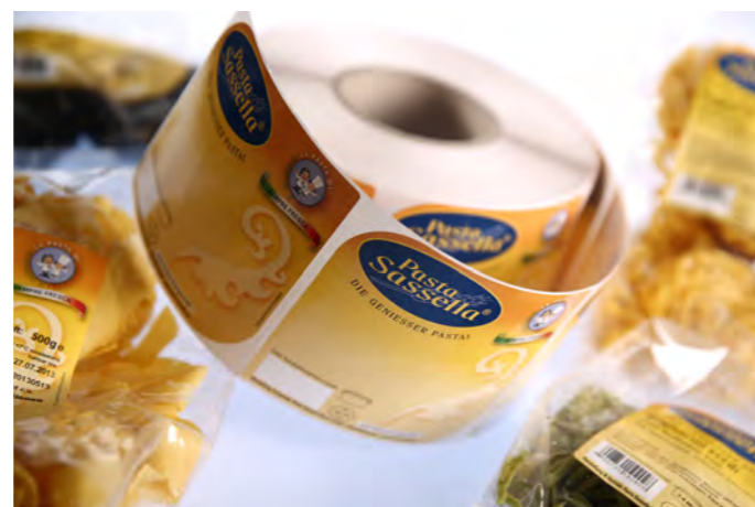
Formgestanztes Selbstklebeetikett für Pasta