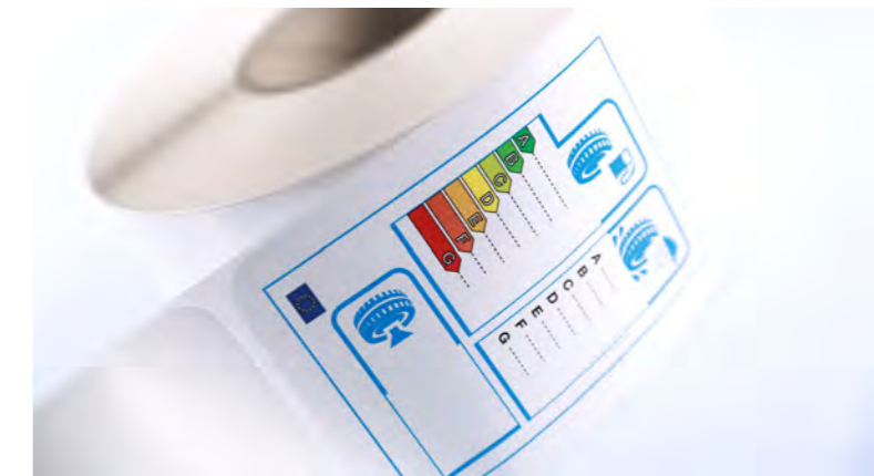
Selbstklebeetikett mit Spezialkleber zur Etikettierung von Reifen

Wir bieten Ihnen zahlreiche Etikettenlösungen an, die perfekt auf Ihre Aufgabenstellung abgestimmt sind. Ständig fließen Neuerungen und Verbesserungen in die Etikettenmaterialien und -kleber ein. Wir kennen die Marktgegebenheiten ganz genau, sprechen Sie mit uns!