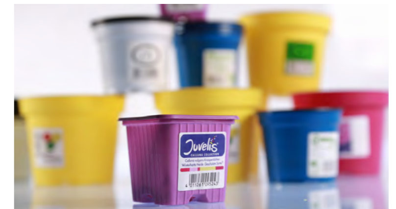
Selbstklebendes Auszeichnungsetikett für Gartenbedarf