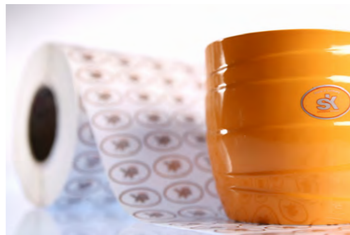
Selbstklebendes Markenetikett für Keramik