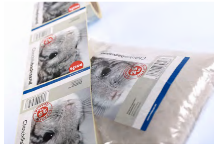
Selbstklebendes Auszeichnungsetikett für Tierbedarf

Seit mehr als 30 Jahren vertrauen Unternehmen aus allen Branchen auf die Etikettenkompetenz von Bluhm Systeme.