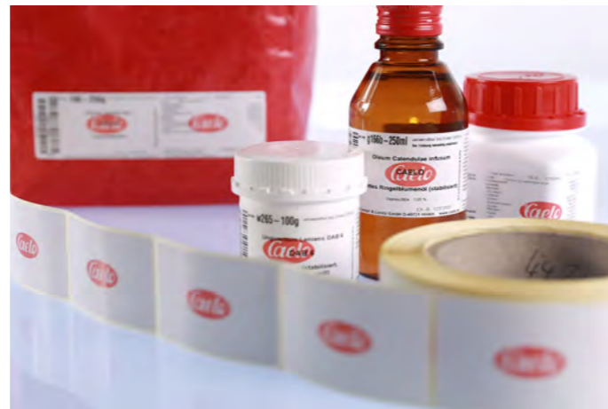
Selbstklebendes Vordrucketikett für Gesundheitsprodukte